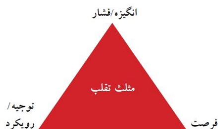
شکل ۱- مثلث تقلب (دورمینی و همکاران، ۲۰۱۲: ۵۵۸)

در این مطالعه، از نظریه مثلث تقلب برای درک تقلب پژوهشی توسط دانشجویان و دانش‌آموختگان استفاده شده است، زیرا ضمن اینکه این نظریه توسط بسیاری از پژوهشگران در رشته حسابداری مورد استفاده قرار گرفته است (چو و تان، ۲۰۰۸؛ الشبیل و همکاران، ۲۰۲۱؛ حجازی و همکاران، ۱۳۹۹)، حرفه حسابداری و حسابرسی، سودمندی مثلث تقلب را در مورد تقلب، به رسمیت شناخته است (محمدی‌مقدم و همکاران، ۱۳۹۷). مثلث تقلب، یک فناوری مدیریت تقلب است که به گونه هم‌زمان ویژگی‌های فردی اخلاقی و شرایط سازمانی را هدف قرار می‌دهد (مورالس و همکاران، ۲۰۱۴). از این رو، نظریه مثلث مورد استفاده قرار گرفته است، زیرا الگوی پذیرفته شده مناسبی برای پیش‌بینی نیت و قصد انجام سرقت ادبی به شمار می‌آید. ایجاد الگوهای تقلب در دهه ۱۹۵۰ از مثلث تقلب شروع شد. چارچوب مثلث تقلب که به صورت رسمی توسط حرفه حسابرسی به عنوان بخشی از بیانیه استانداردهای حسابرسی شماره ۹۹ آمریکا انتخاب شده است، توسط «دونالد کریزی» ایجاد شد. این نظریه بر اساس پژوهش‌های او در مورد جرائم یقه‌سفید و اختلاس توسط افراد مورد اعتماد است (چلیاتسیدو و همکاران، ۲۰۲۳). شکل ۱، اجزای مثلث تقلب را نشان می‌دهد.