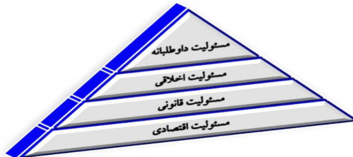
شکل ۱: هرم مسئولیت اجتماعی از دیدگاه کارول

ترکیب کرد. کارول مسئولیت‌پذیری اجتماعی هر شرکت را در چهار بعد مسئولیت اقتصادی ۱ ، مسئولیت قانونی ۲ ، مسئولیت اخلاقی ۳ و مسئولیت داوطلبانه ۴ مطرح کرد. کارول رده‌های مسئولیت‌پذیری اجتماعی شرکت‌ها را در قالب هرم زیر پیشنهاد کرد (رضایی و رضایی، ۱۳۹۵).