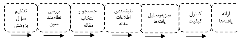
شکل ۱. مراحل هفت‌گانه پژوهش (سندلوسکی و بارسو)

در این پژوهش از روش هفت مرحله‌ای فرا ترکیب سندلوسکی و بارسو (۲۰۰۷) استفاده شده که در شکل ۱ نشان داده شده است.