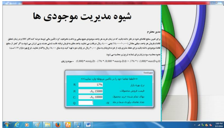
شکل ۳- شروع فرایند انتخاب سطح بهینه سفارش موجودی کالا

پس از اینکه شخص آزمون شونده سطح سفارش مورد نظر خود را انتخاب نمود، نرم افزار تقاضای واقعی ماه مزبور را همانند شکل شماره (۴) نمایان خواهد نمود و آزمون شونده را قادر به محاسبه ضرر و زیان خود (اعم از هزینه فرصت از دست رفته و یا هزینه فساد کالای باقیمانده) می نماید. شکل ۴- آگاه سازی آزمون شونده نسبت به تقاضای واقعی در هر انتخاب