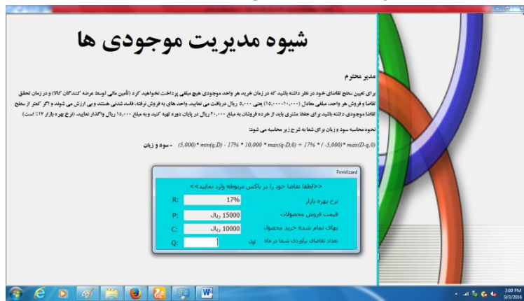
شکل ۳- شروع فرایند انتخاب سطح بهینه سفارش موجودی کالا

پس از اینکه شخص آزمون شونده سطح سفارش مورد نظر خود را انتخاب نمود، نرم افزار تقاضای واقعی ماه مزبور را همانند شکل شماره (۴) نمایان خواهد نمود و آزمون شونده را قادر به محاسبه ضرر و زیان خود (اعم از هزینه فرصت از دست رفته و یا هزینه فساد کالای باقیمانده) می نماید.