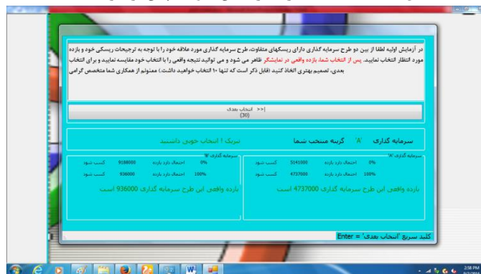
شکل ۱- نتیجه آگاه سازی آزمایش شونده پس از هر انتخاب

این فرایند تا ده مرتبه تکرار خواهد شد و بدین ترتیب آزمایش شونده‌گان به سه دسته ریسک پذیر، ریسک خنثی و ریسک گریز تقسیم می شوند و در مقایسه انتخاب های دهگانه با نتایج واقعی برای هر یک از افراد ریسک پذیر، ریسک خنثی و ریسک گریز، هدف پژوهش در ارزیابی کسب بیشترین سطح مطلوبیت میسر خواهد گردید. پس از تعیین ترجیحات ذهنی آزمون شونده‌گان و تشخیص میزان گرایش ذهنی افراد نسبت به ریسک، نرم افزار از طریق شکل شماره (۲) وارد فاز اجرایی دوم خواهد شد.