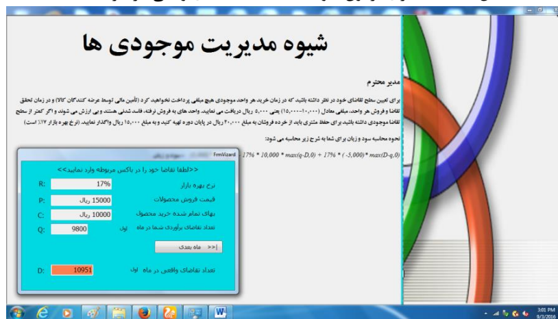
شکل ۴- آگاه سازی آزمون شونده نسبت به تقاضای واقعی در هر انتخاب

این فرایند در قالب دو دوره سی ماهه انجام خواهد گرفت. در جدول شماره (۵) انتخاب دهگانه آزمایش شوندهگان قابل مشاهده است.